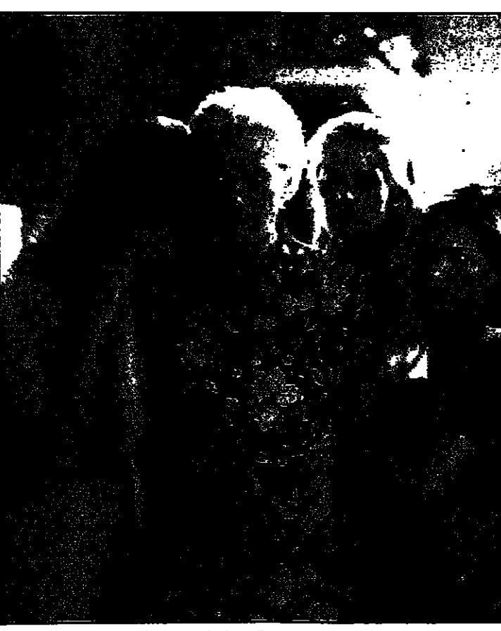
نساء مافيا وتصورات بطون العصابات لبعضهن البعض في مسلسل مافيا، من اليسار إيلينا تورغاس وديغريف وناستازيا كينسكي وفانيسا وديغريف في أول زيجات المافيا الصامتة على الإطلاق من قتل أزواجهن